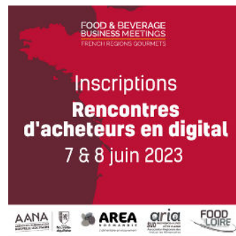
Des rendez-vous d'affaires en digital sur 4 régions de France