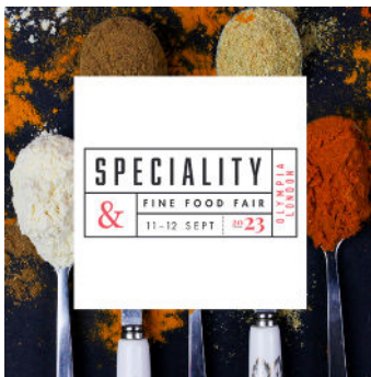
Salon anglais spécialisé pour les produits d'épicerie fine et artisanaux