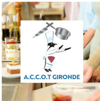
Rencontre entre acteurs de la restauration collective en Gironde