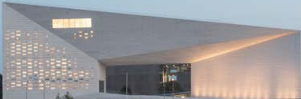
La MÉCA, Maison de l'économie créative et de la culture de la Région Nouvelle-Aquitaine - Bordeaux